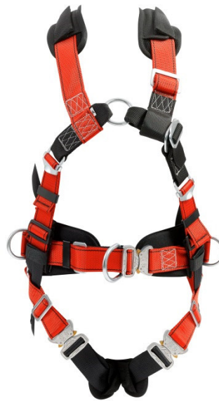
Abb. MB100 S mit Steigschutzöse