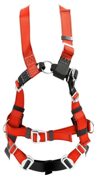
Abb. MB100 Vorderseite

gepr. nach EN 361:2002 und EN 358:2000-2 mit integrierter Haltefunktion