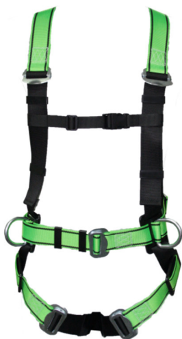
Abb. MB95-E Vorderseite

gepr. nach EN 361:2002 und EN 358:2000-2 mit integrierter Haltefunktion