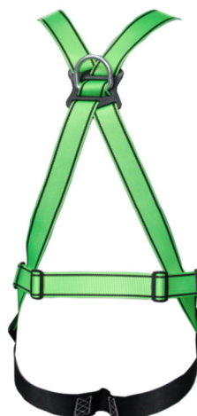
Abb. MB95-E Rückseite